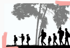
Deportes en la Naturaleza